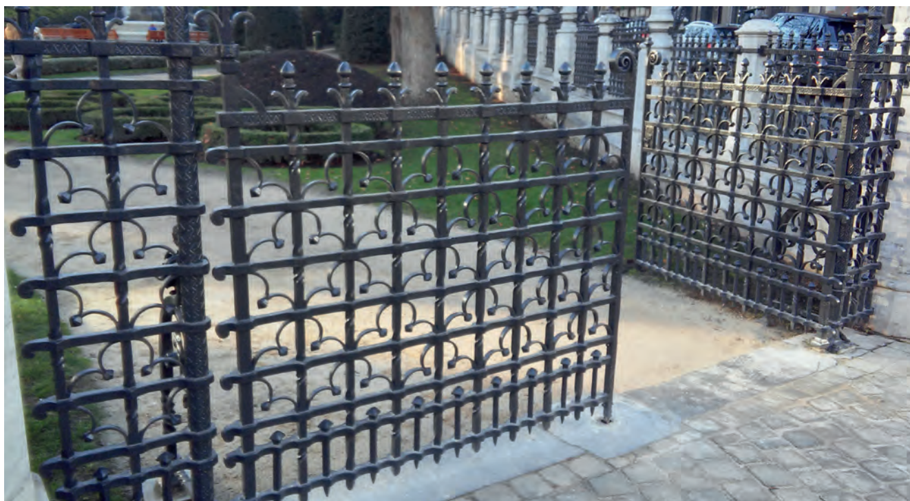
■ Het smeedwerk is zeer aanwezig in het straatbeeld (poorten en hekken, versieringen deuren, muurankers ...) en in sierobjecten thuis of in musea. Op de foto: de toegangspoort van de Kleine Zavel, een werk van kunstsmid Piéret, is een van de bekendste smeedwerken in Brussel.