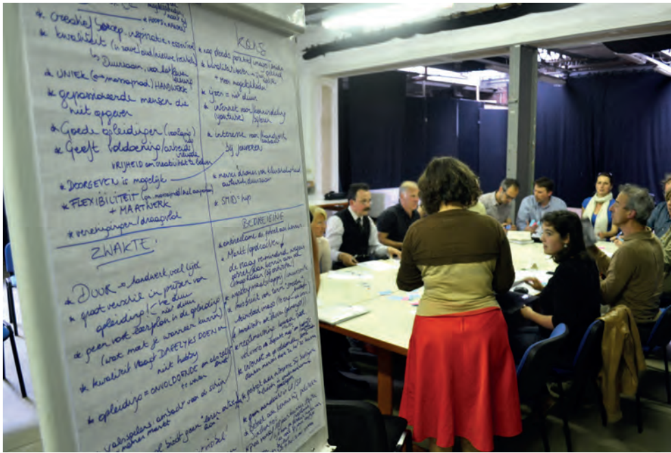
■ Uit de conclusies van de studienamiddag bleek dat het ambacht in diverse instellingen wordt aangeleerd als een basisopleiding, maar dat voortgezette opleidingen nog ontbreken.

Het project werkte rond de thema's onderzoek en documentatie, opleiding en overdracht, en communiceren en sensibiliseren. Deze bijdrage stelt de belangrijkste resultaten voor.